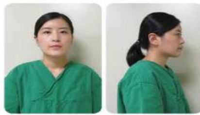
개인보호구 착용 준비