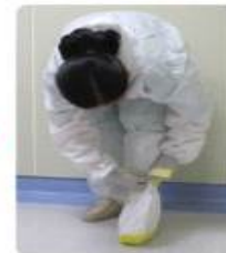
신발끈 매듭 묶기