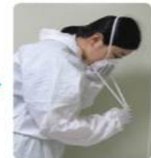
N95 마스크 착용