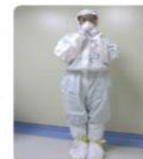
보호복 착용 점검