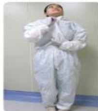
지퍼를 끝까지 올린다