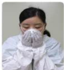
N95 마스크 밀착 확인