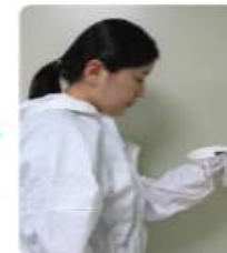
N95 마스크 착용준비