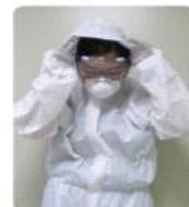
보호복 후드 착용