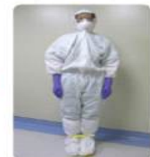
보호복 착용 상태 확인